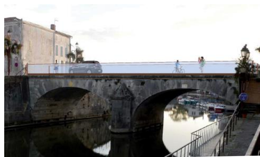
Vue vers le Pont de pierre avec nouveau garde-corps - Photomontage