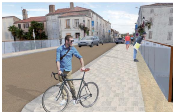
Vue sur le pont avec réorganisation des circulations et nouveau garde-corps - Photomontage