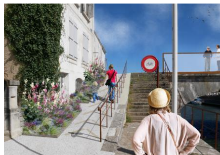
Proposition de traitement de rampe - photomontage