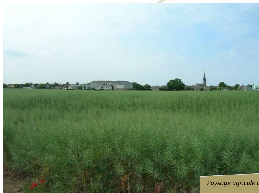
Paysage agricole ouvert