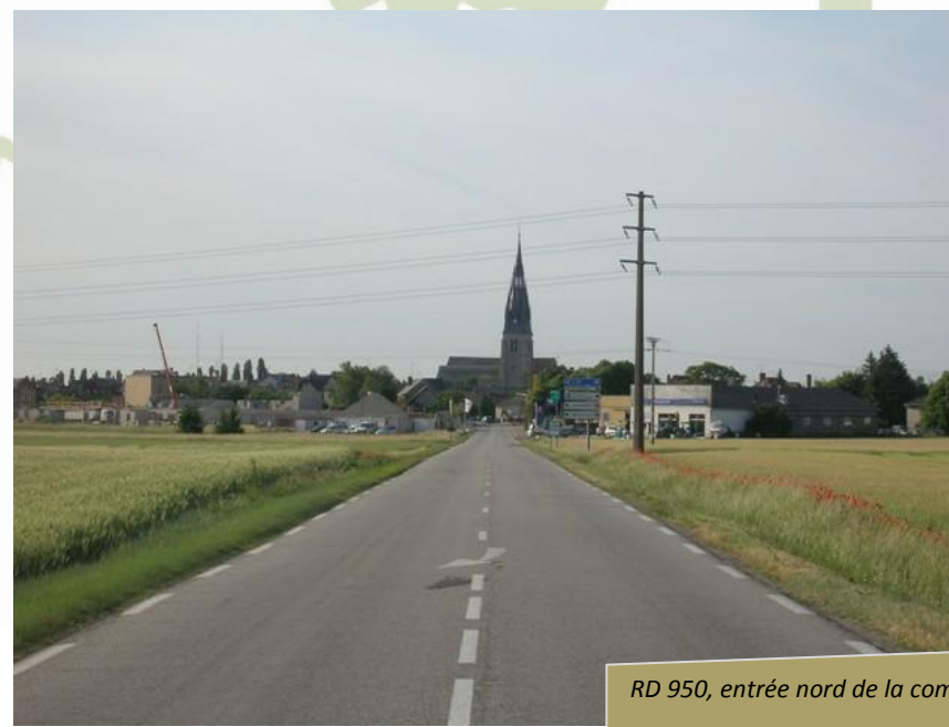
RD 950, entrée nord de la commune