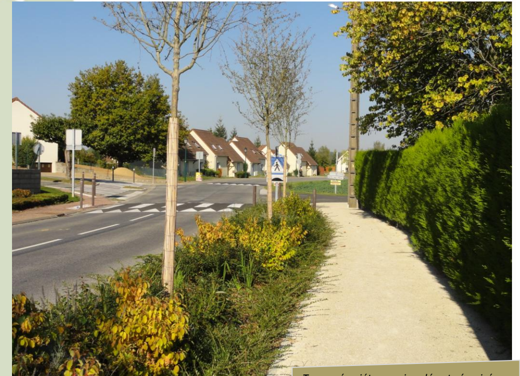
Traversée piétonne signalée et sécurisée