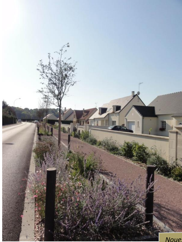
Noues paysagères filtrantes plantées d'un alignement d'arbres

La présence végétale est renforcée par la plantation d'un alignement d'arbres et de noues paysagères qui donne un aspect plus qualitatif à la rue, en accord avec le tissu pavillonnaire traversé.