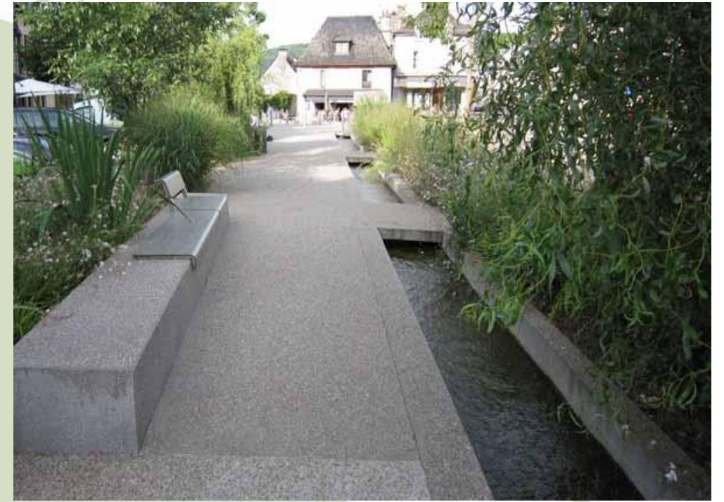
Images de références d'ambiances recherchées pour le parking