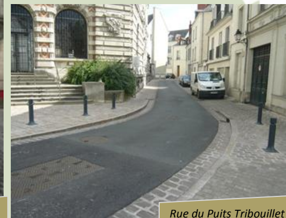
Rue du Puits Tribouillet