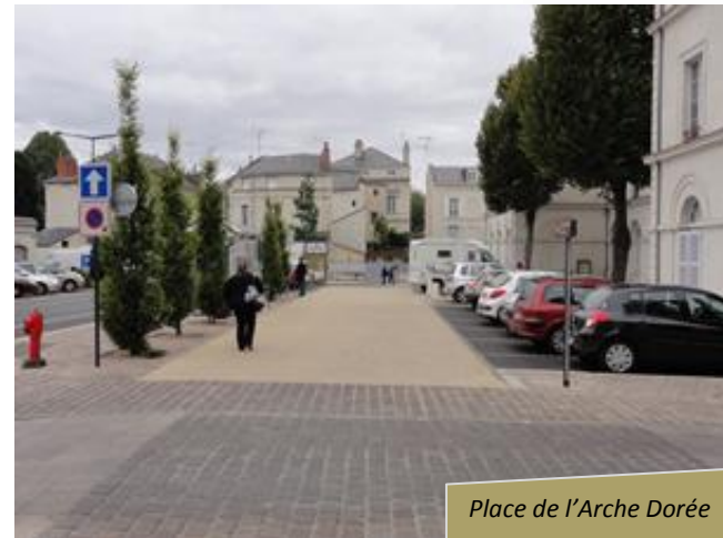
Place de l'Arche Dorée