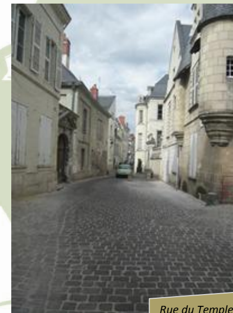
Rue du Temple