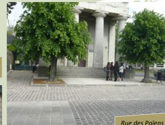
Rue des Pâiens