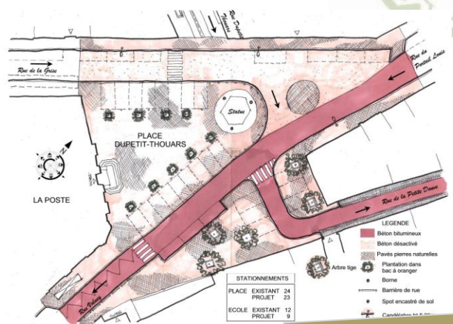
Place du Petit Thouars