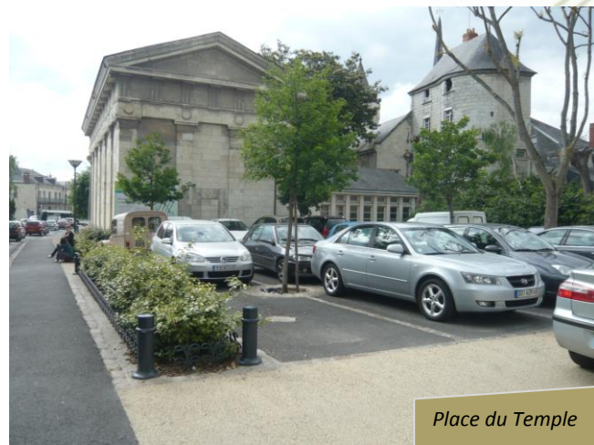
Place du Temple