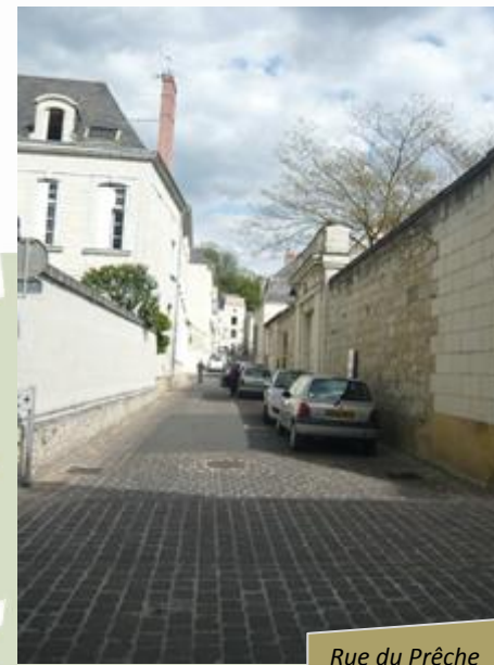
Rue du Prêche